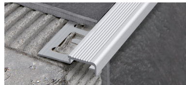
PROSTAIR KL 20 (Pag. 122)