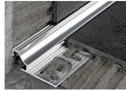
PROSHELL R ALL (Pag. 60)