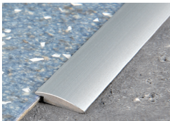
PROLINOLEUM (Pag. 87)