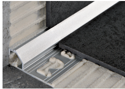
PROSHELL D ALL (Pag. 60)