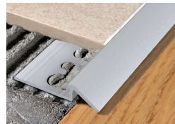
PROSLIDER KL ALL (Pag. 88)