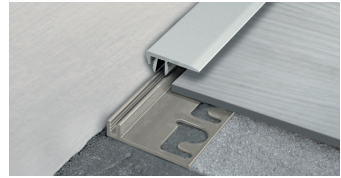
TERMINAL PIN (Pag. 222)