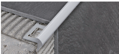
PROSTYLE KL 10 (Pag. 122)