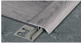
ZERO CURVE (Pag. 222)