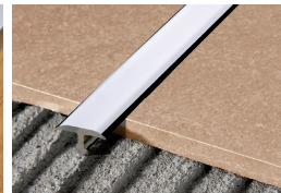
PROCOVER 1045 ALL (Pag. 88)