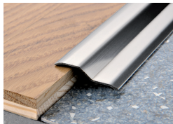
PROFLOOR 24 (Pag. 87)