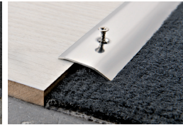
PROLEVAL 305 (Pag. 82)